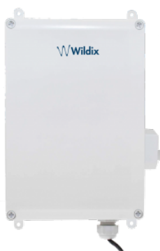
W-AIR Base Sync Plus Outdoor