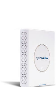
W-AIR Sync Plus