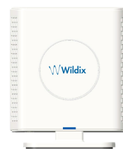
W-AIR Base Small Business