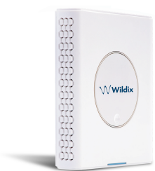
W-AIR Sync Plus