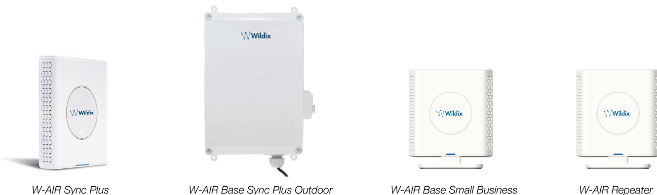
W-AIR Sync Plus