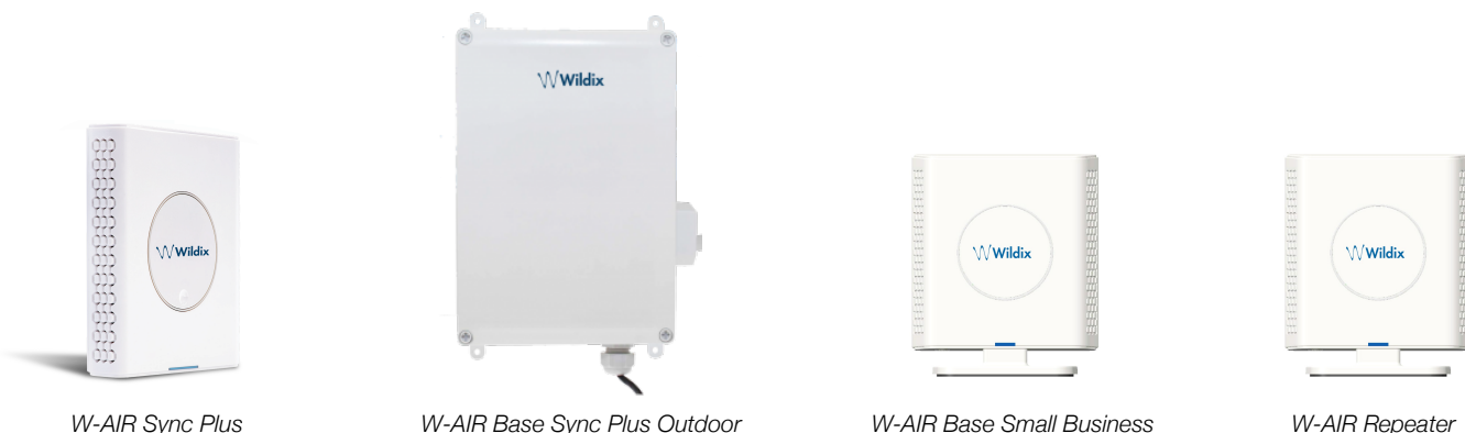
W-AIR Sync Plus