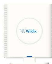
Base W-AIR Small Business