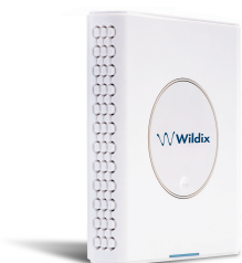
W-AIR Sync Plus