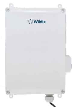
Base W-AIR Sync Plus Outdoor